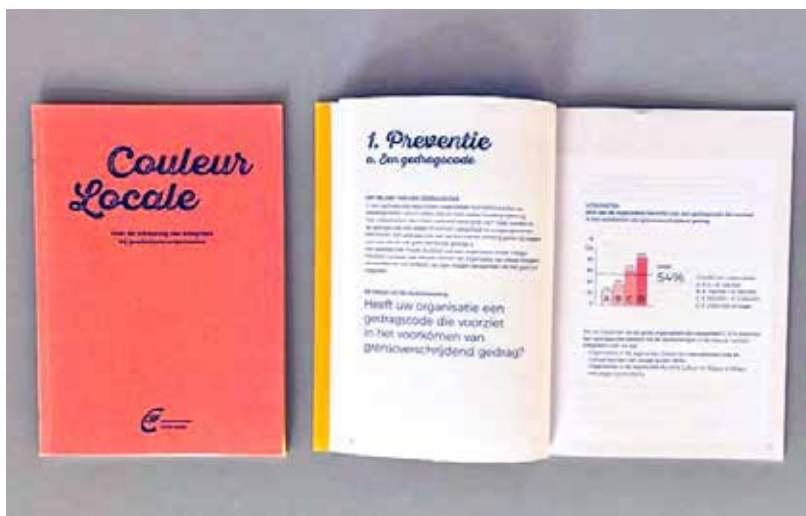
Werkboekje Couleur Locale: feiten en vragen over integriteit