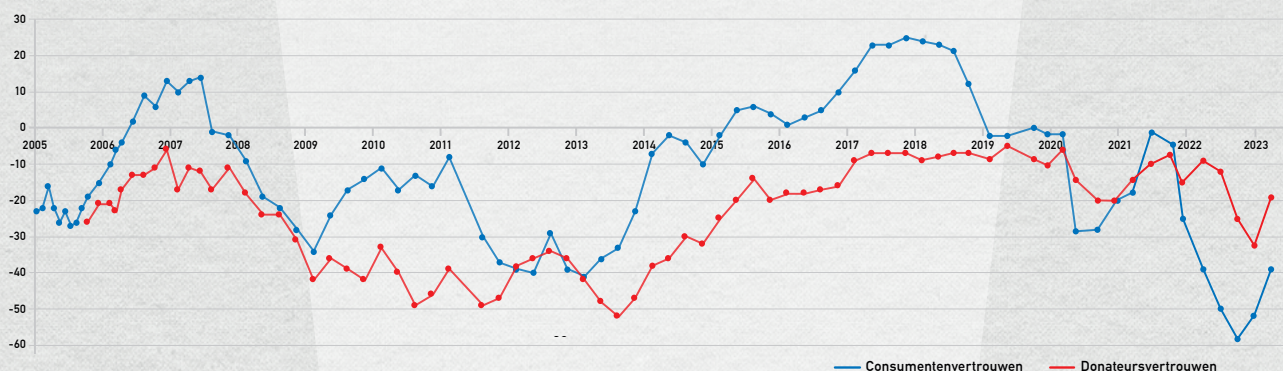
Figuur 1: Ontwikkeling van donateurs- en consumentenvertrouwen 2005-2023