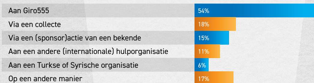
Figuur 4: Als je hebt gedoneerd, hoe heb je dat gedaan? Meerdere antwoorden mogelijk.