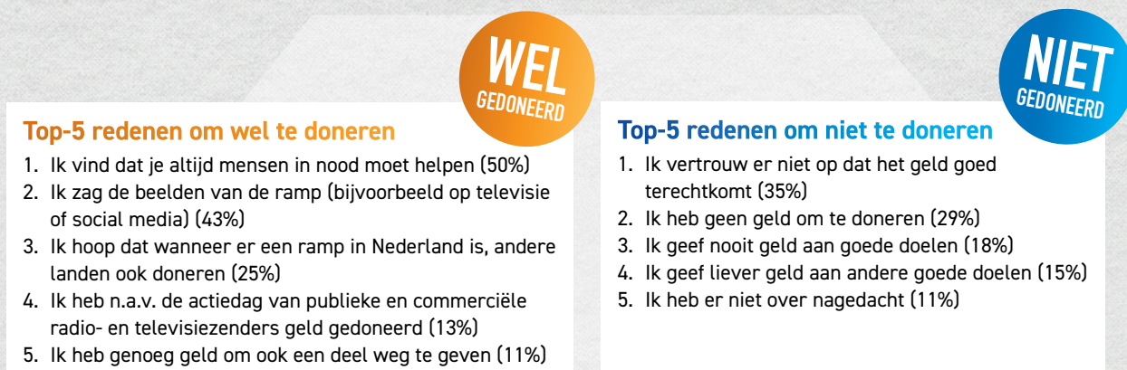
Figuur 5: 'Wat bewoog u ertoe om geld te geven?' tegenover 'Wat is de reden dat u in de afgelopen maand geen geld heeft gedoneerd?'. Meerdere antwoorden mogelijk.

We willen graag weten waarom mensen juist wel of juist niet hebben gegeven voor de slachtoffers van de aardbeving. Wat is hun motivatie om het te doen of om het juist niet te doen?