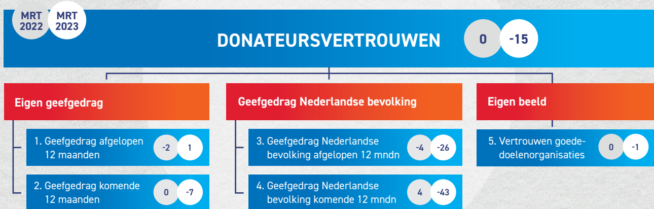
Figuur 2: Samenstelling donateursvertrouwen, maart 2022 (links in grijze cirkel) vs. maart 2023 (rechts in witte cirkel). Het donateursvertrouwen wordt berekend door het gemiddelde van de vijf blauwe vragen te nemen.

Vorig jaar in de maand maart stond het donateursvertrouwen op 0. Dit jaar, als we alleen naar maart kijken, is het indexcijfer -15. Uit onderstaand figuur blijkt dat het verschil van nu met een jaar geleden vooral zit in het geefgedrag van de Nederlandse bevolking, zowel voor de inschatting van het geefgedrag van afgelopen jaar (-26) als de verwachting voor komend jaar (-43). Dit zal zeker met de huidige inflatie te maken hebben. Positief is dat de blik op het eigen geefgedrag (zowel van afgelopen jaar als aankomend jaar) gemiddeld gelijk is gebleven.